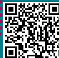
Arbeit und Leben